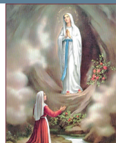
Santa Bernardita Soubirous