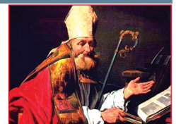
San Policarpo, Obispo y mártir