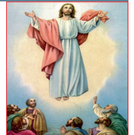
La Ascensión del Señor