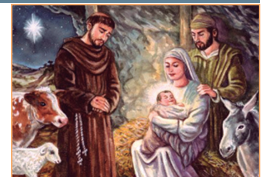
Navidad del Señor