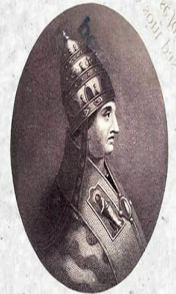
Papa Bonifacio VIII

El primer Jubileo oficial en la Iglesia Católica lo convocó el Papa Bonifacio VIII en el año 1300, y se tenía contemplado convocarlo cada 100 años, pero la frecuencia fue cambiando.