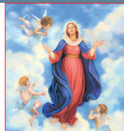
Asunción Virgen María