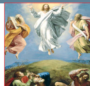
La Transfiguración del Señor