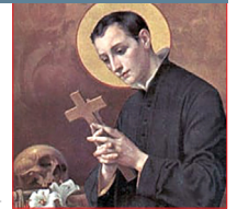
San Luis Gonzaga