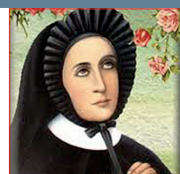
Beata Mercedes de Jesús