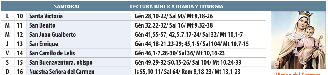
Virgen del Carmen