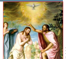
Bautismo del Señor