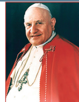
San Juan XXIII, Papa