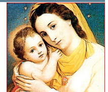
Virgen de la Merced