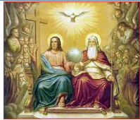
La Santísima Trinidad