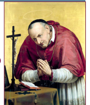
San Alfonso María de Ligorio