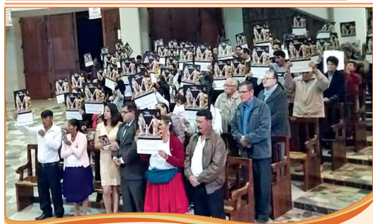
IMAGEN Y SEMEJANZA

El misterio del hombre y de la mujer es tan profundo que su mutua unidad se convierte en imagen y semejanza de la alianza de Dios con los hombres, en representación del amor, la fidelidad y su fuerza creadora. Dios, que es Amor (cf. 1 Jn 4,8.16), ha creado al hombre a su imagen y semejanza, es decir, con capacidad y vocación para amar y no para odiar.