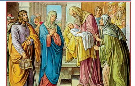
La Presentación del Señor