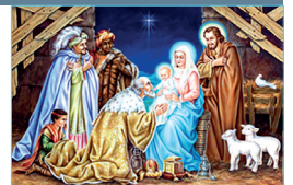
Epifanía del Señor