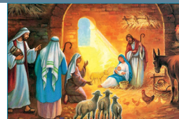
Navidad del Señor