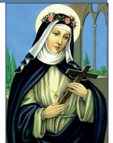
Santa Rosa de Lima