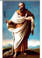
San Bartolomé, Apóstol