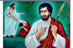
Santo Tomás Apóstol