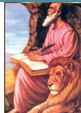
San Marcos, Evangelista