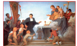
San Miguel Febres Cordero