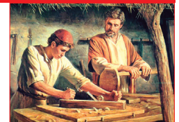
San José, obrero