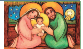
Navidad del Señor