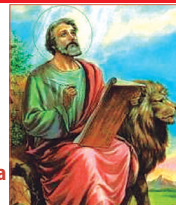
San Marcos Evangelista