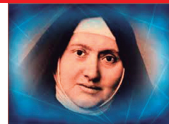
Santa Gertrudis Comensoli