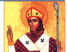
S. Hilario, Obispo y Doctor